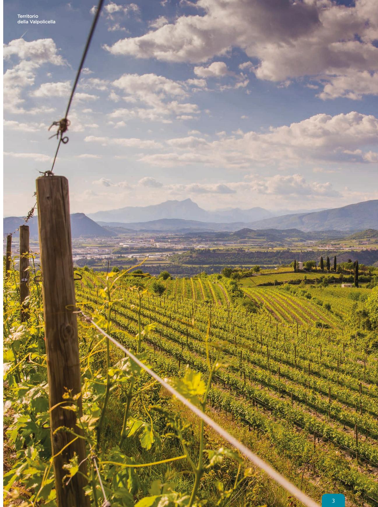
Territorio della Valpolicella