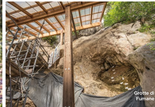
Grotte di Fumane

Caratterizzato da una notevole varietà di ambienti e di paesaggi