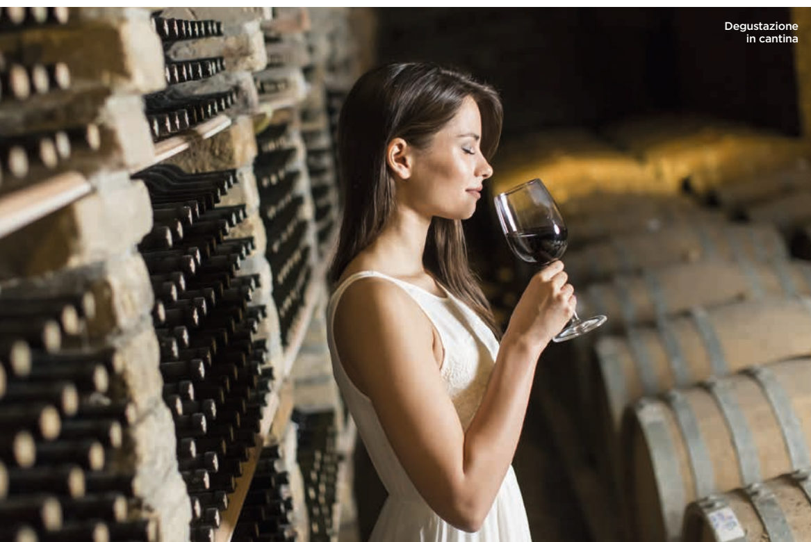
Degustazione in cantina

Il territorio è servito dall'aeroporto Valerio Catullo di Verona Villafranca ( www.aeroportoverona.it )