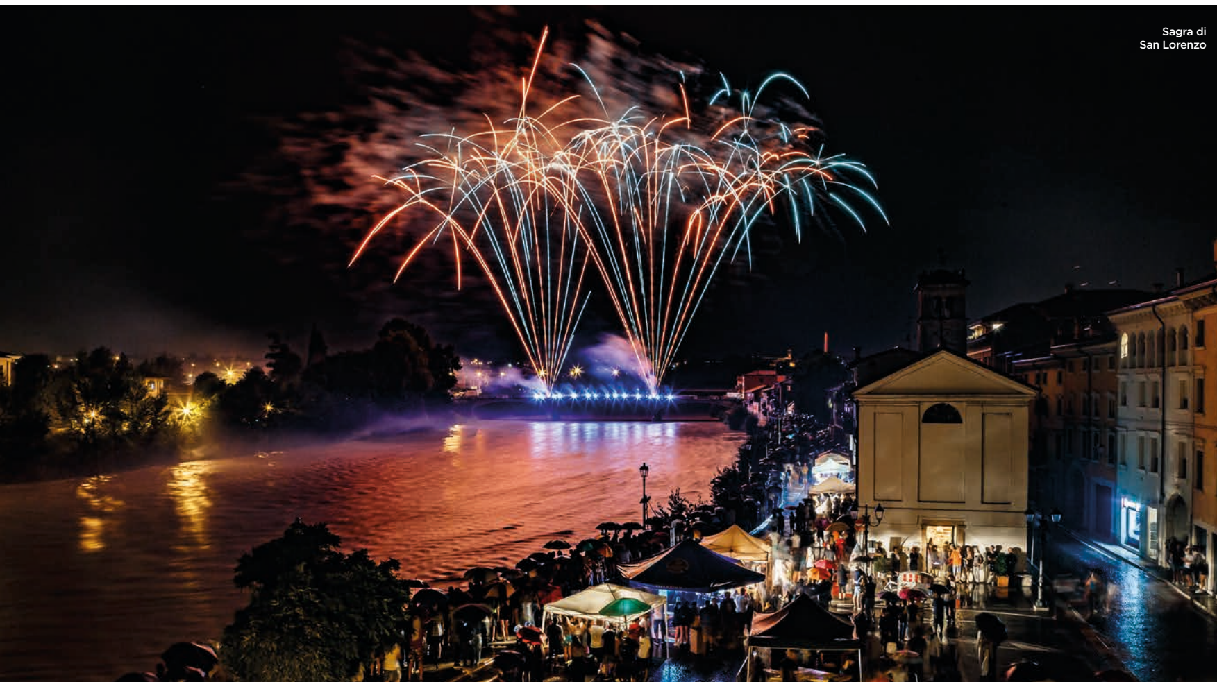
Sagra di San Lorenzo

Anche nelle frazioni si possono trovare elementi di notevole interesse artistico e paesaggistico: nello storico borgo di Arcè, la Villa Da Sacco e la Chiesa di San Michele Arcangelo, pregevole esempio di architettura romanica veronese; a Santa Lucia la Chiesetta di Santa Lucia e il complesso termale Aquardens; a Ospedaletto Villa Quaranta, con il suo importante parco termale; a Balconi il Monumento agli Ex internati; a Settimo palazzi come Villa Bertoldi, Villa Mirandola e Villa Sparvieri.