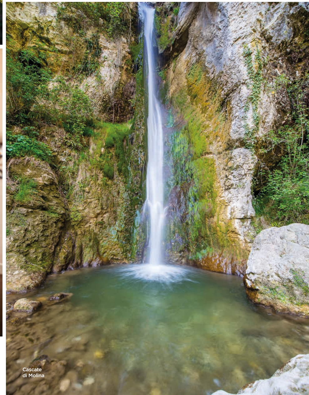
Cascate di Molina