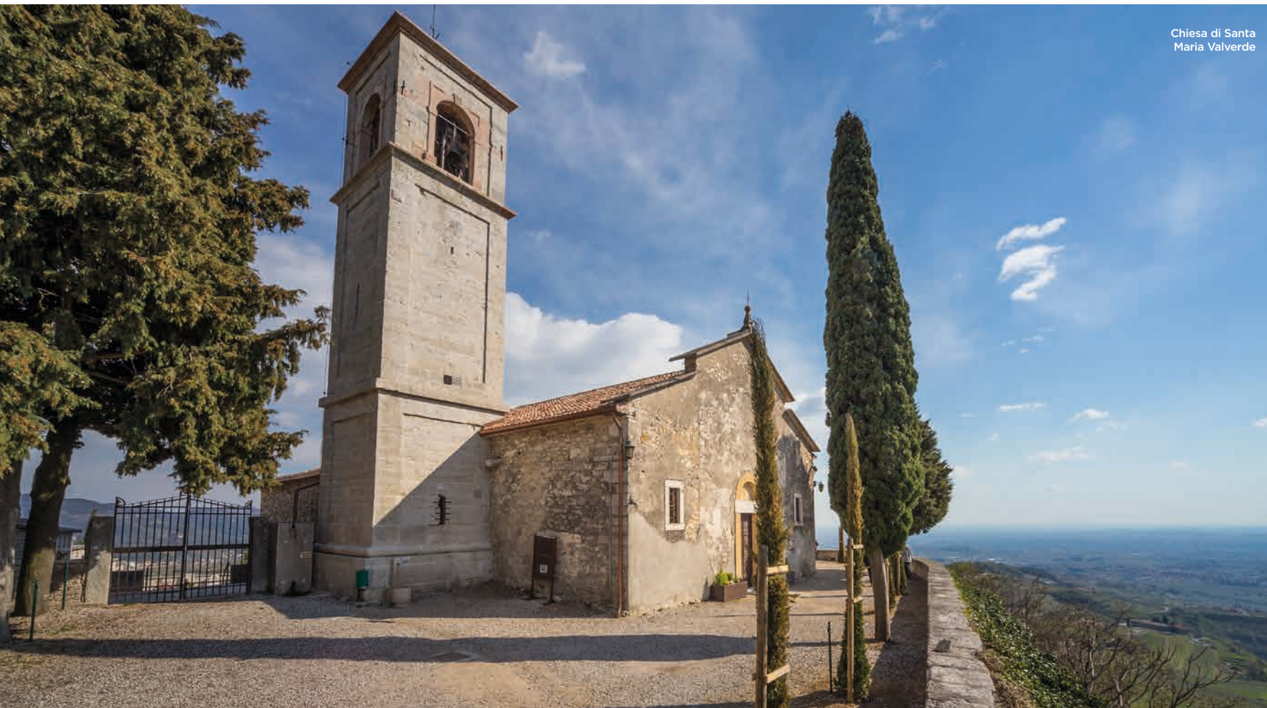
Chiesa di Santa Maria Valverde

Il dolce paesaggio agrario non è stato alterato