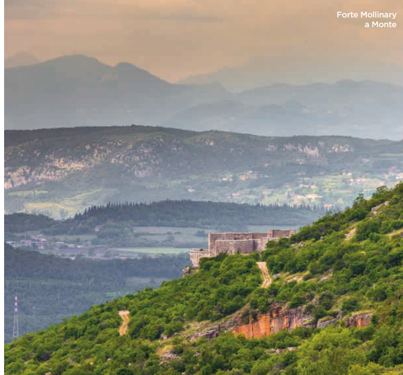
Forte Mollinary a Monte