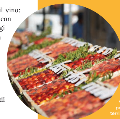
Varietà di pesche del territorio