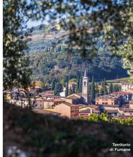
Territorio di Fumane

Fumane si trova al centro della Valpolicella ed è caratterizzato da una notevole varietà di ambienti e di paesaggi: distese di vigneti, ciliegeti e frutteti nelle zone collinari, boschi e prati nell'area montana. In prossimità di Molina si apre a ventaglio la più profonda delle vallate della Lessinia, in cui i torrenti hanno formato una decina di imponenti cascate. Per valorizzare un simile tesoro naturalistico, è stato creato il Parco delle Cascate, un susseguirsi di torrenti, cascate d'acqua, laghetti, balconi di roccia e caverne dette coaloni. Ma il borgo di Molina è interessante anche per l'architettura di pietra locale della Lessinia, con le sue strette vie e le piccole corti.