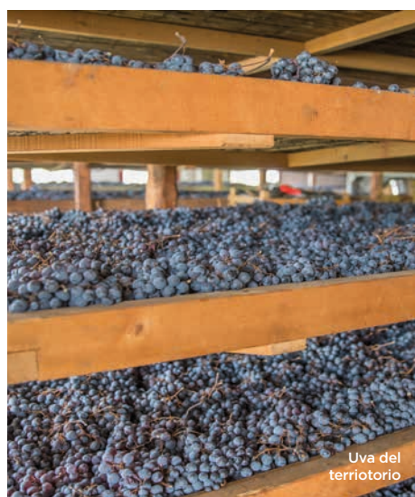
Uva del territorio

Poco a nord di Verona e ad est dal Lago di Garda si trova la Valpolicella, territorio unico nel suo genere, con le sue colline ricoperte da vigneti e circondate da ville storiche, borghi antichi e corti rurali in pietra locale. La Valpolicella, più che una valle unica, è un ventaglio di piccole valli interrotte da corsi d'acqua noti come progni, digradanti verso sud sulle colline alle spalle di Verona.