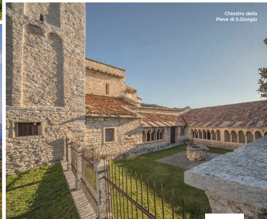
Chiostro della Pieve di S. Giorgio

“La porta naturale di accesso alla Valpolicella”