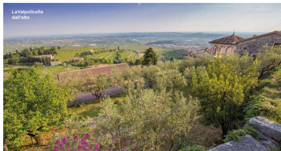
La Valpolicella dall'alto