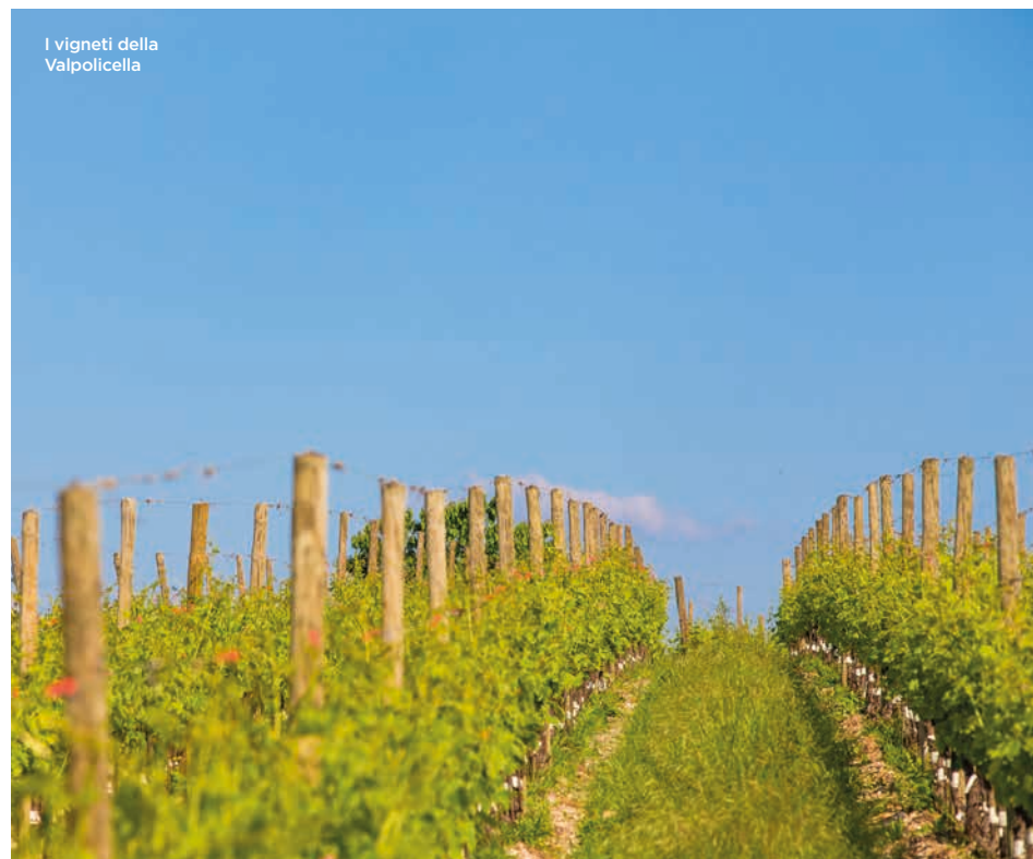
I vigneti della Valpolicella