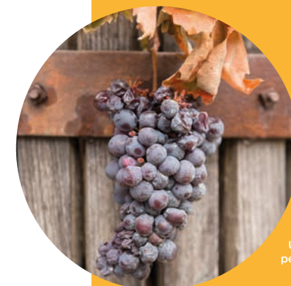
Uva utilizzata per l'Amarone

Ma le colline della Valpolicella non sono famose soltanto per il vino: tantissimi sono i prodotti tipici di questa zona. Al confine con la Lessinia, per esempio, la tradizione casearia crea formaggi di gran gusto, come il Monte Veronese. Vi è inoltre una lunga tradizione nella produzione di insaccati di carne suina, come sopresse e salami. In Valpolicella è diffusa anche la produzione di olio extravergine di oliva, di colore verde-oro intenso e dal sapore marcato. Tra la frutta non si possono non ricordare le ciliegie, le numerose varietà di pesche (a polpa gialla o bianca, nettarine, pesche noci) e il pero misso (il termine misso in dialetto veronese indica un frutto sovramaturato, con un colore scuro e di consistenza molle).