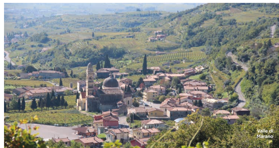
Valle di Marano

Nel cuore della Valpolicella si incunea la valle di Marano, quella che ha meglio conservato il paesaggio tradizionale della Valpolicella. Qui infatti il dolce paesaggio agrario non è stato alterato e, se vigne e ciliegi dominano ormai la bassa e la media collina, non mancano macchie di ulivi e di conifere. Nell'area più a monte prevalgono i boschi e tutto il territorio si presta a comode escursioni su sentieri ben tracciati che partono da Malga Biancari verso il ponte tibetano e la splendida Valsorda. Una magnifica visione d'insieme si può avere dal piazzale della chiesa di Santa Maria Valverde: lo sguardo spazia da Verona al Lago di Garda e nelle giornate limpide arriva fino agli Appennini.