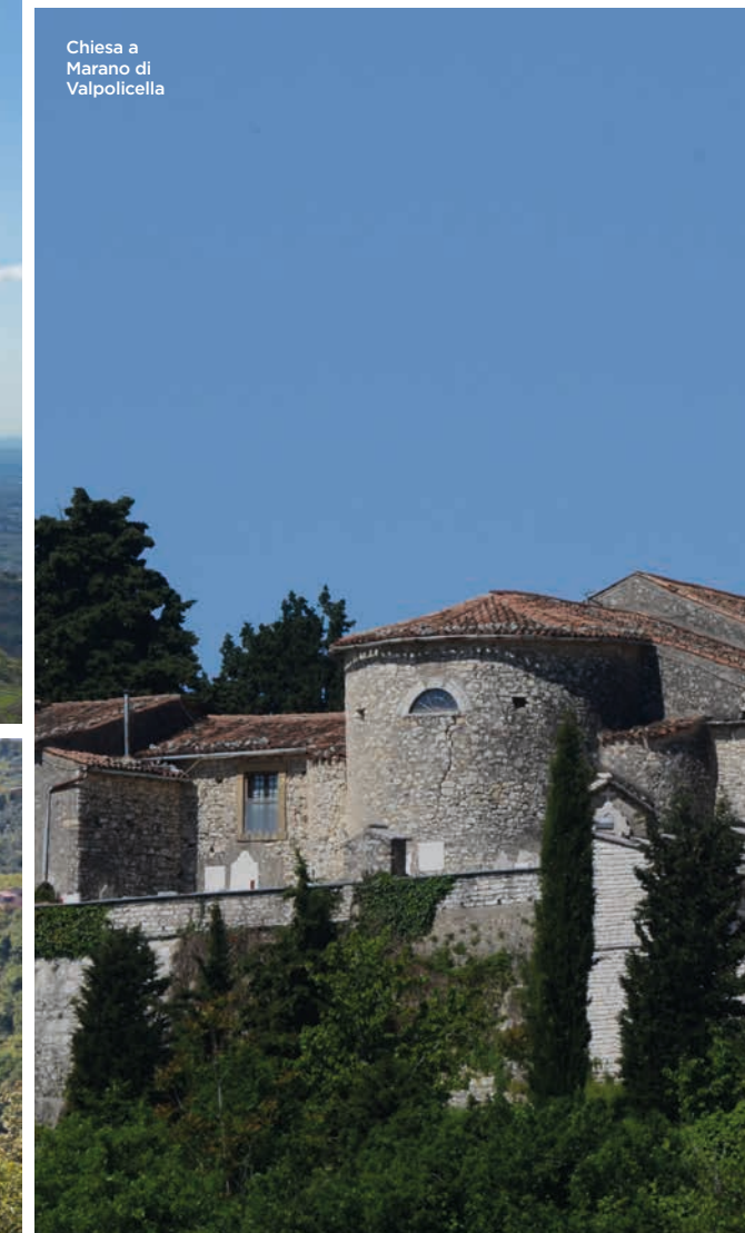
Chiesa a Marano di Valpolicella

Il dolce paesaggio agrario non è stato alterato