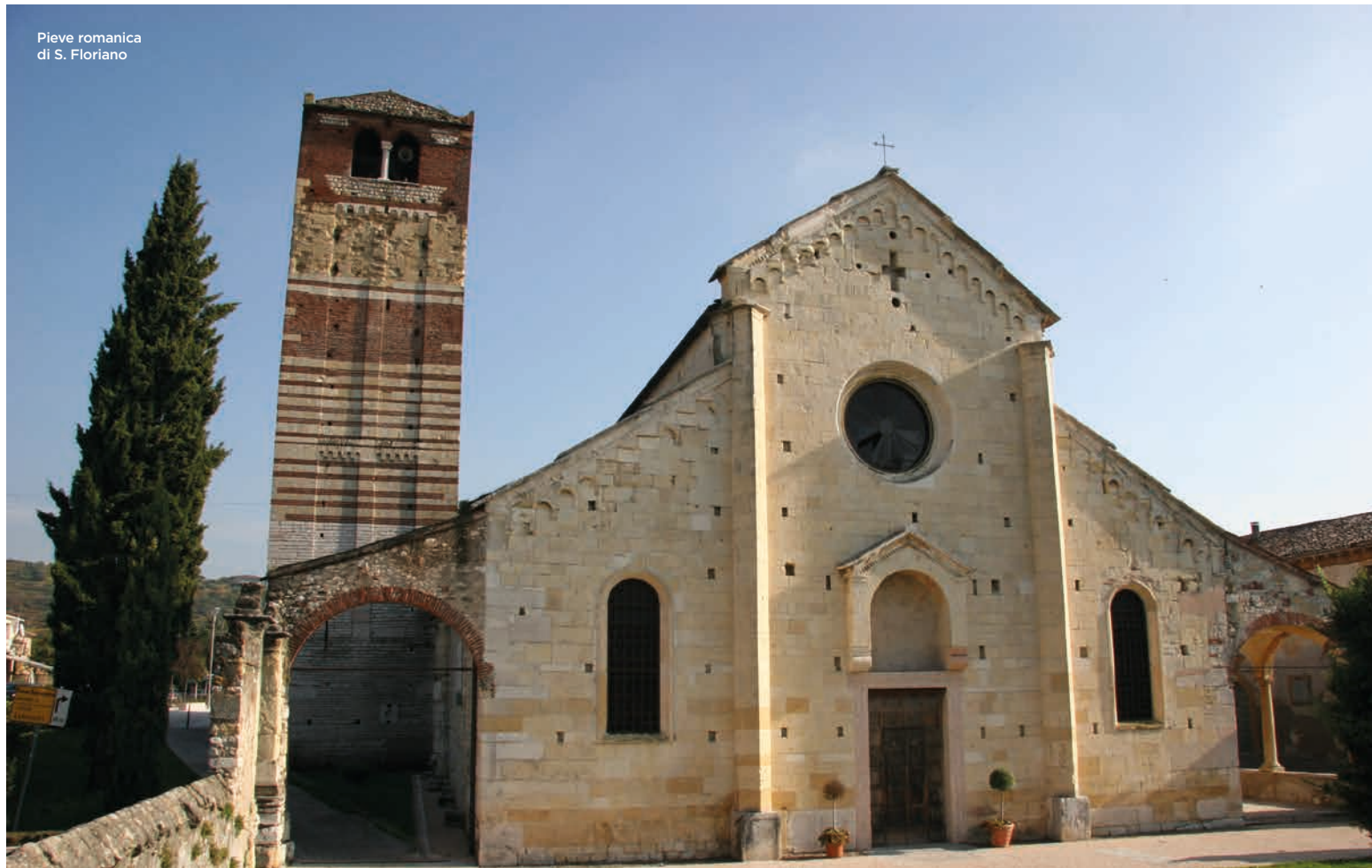
Pieve romanica di S. Floriano