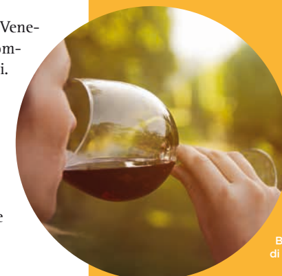
Bicchieri di Recioto