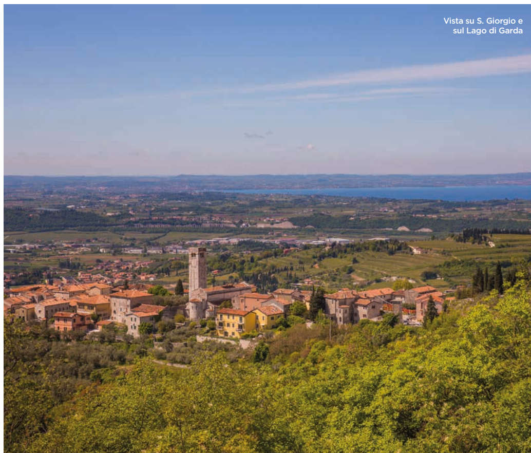
Vista su S. Giorgio e sul Lago di Garda