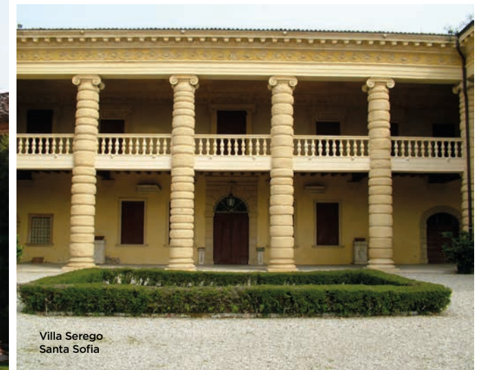
Villa Serego Santa Sofia