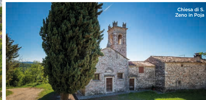
Chiesa di S. Zeno in Poja