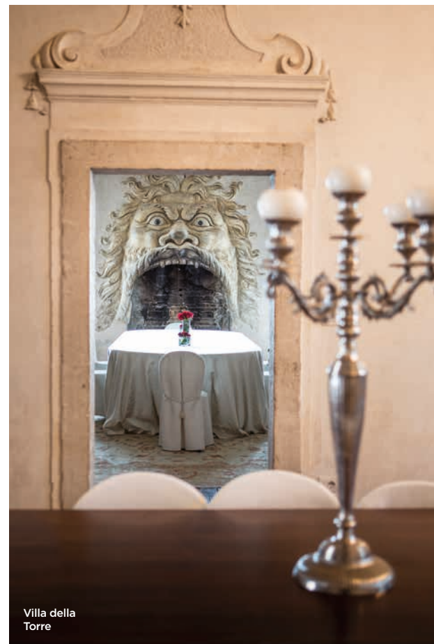
Villa della Torre

Imperdibile è Villa Della Torre, palazzo del '500 con una pianta che ricorda le domus romane, nelle cui sale d'angolo vi sono 4 monumentali camini con bocca a forma di mostro. A Fumane sono stati individuate delle tracce della presenza dell'Uomo di Neanderthal e dell'Homo Sapiens risalenti ad un periodo compreso tra 80 mila e 25 mila anni fa. Questi ritrovamenti, tra i quali il più significativo è rappresentato da alcune pietre dipinte con ocra rossa, sono oggi ancora visibili presso la Grotta di Fumane.